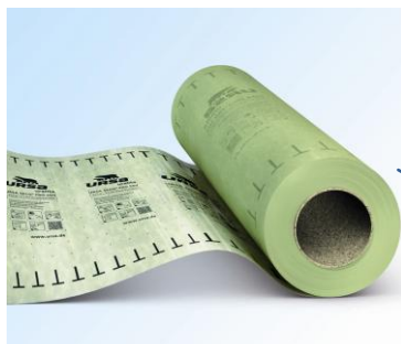
URSA SECO PRO SDV

Az URSA SECO PRO termékcsalád és az URSA ásványgyapot termékek kombinált felhasználásával az épületfizikai követelményeknek legjobban megfelelő épületszerkezeti rétegrénd kialakítást tudunk megvalósítani.