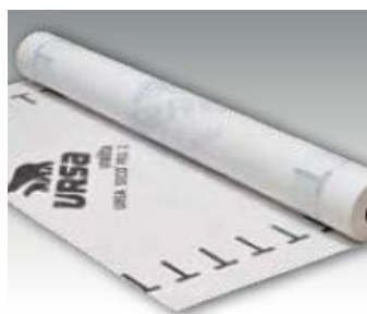
URSA SECO PRO 2

Az URSA SECO PRO termékcsalád és az URSA ásványgyapot termékek kombinált felhasználásával az épületfizikai követelményeknek legjobban megfelelő épületszerkezeti rétegrend kialakítást tudunk megvalósítani.