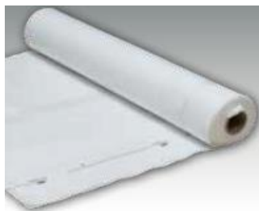
URSA SECO PRO 100

Az URSA SECO PRO termékcsalád és az URSA ásványgyapot termékek kombinált felhasználásával az épületfizikai követelményeknek legjobban megfelelő épületszerkezeti rétegrend kialakítást tudunk megvalósítani.